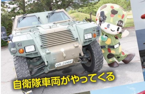
自衛隊車両がやってくる