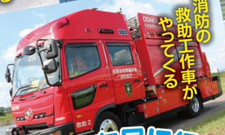
消防の 救助工作車が やってくる