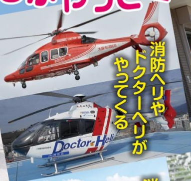
消防ヘリや ドクターヘリが やってくる