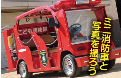
ミニ消防車と 写真を撮ろう