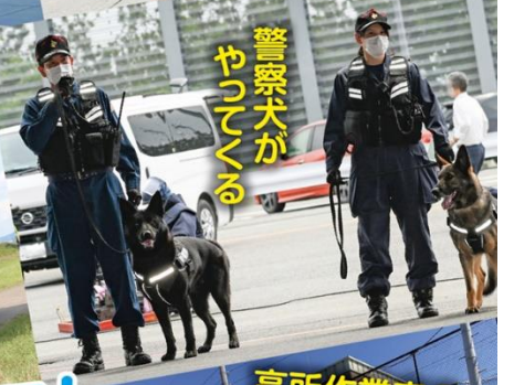
警察犬が やってくる