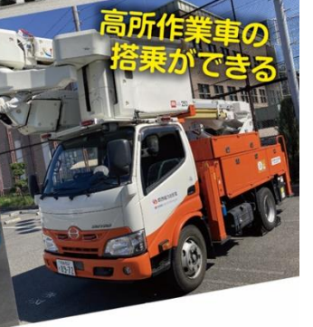
高所作業車の 搭乗ができる