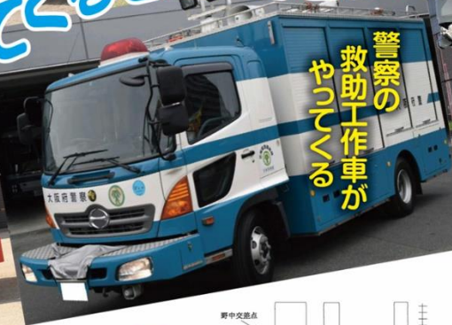
警察の 救助工作車が やってくる