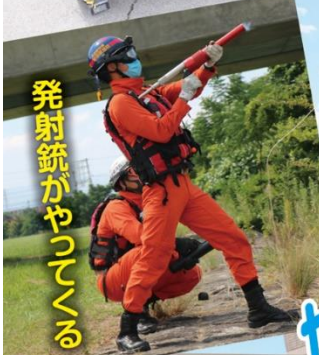
発射銃がやってくる