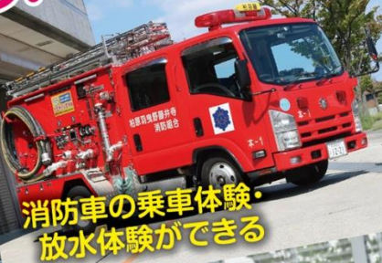
消防車の乗車体験・ 放水体験ができる