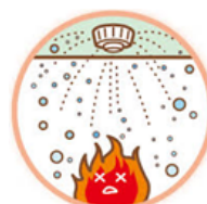
スプリンクラー設備