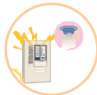
自動火災報知設備